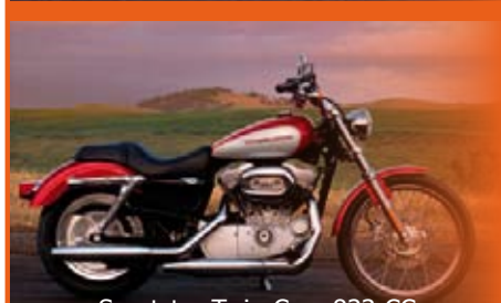
Sportster Twin Cam 833 CC