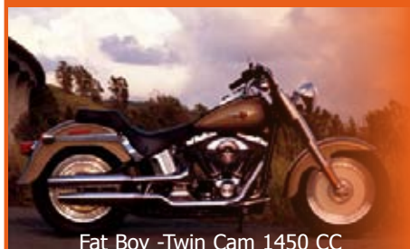
Fat Boy -Twin Cam 1450 CC