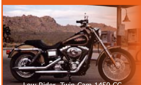
Low Rider -Twin Cam 1450 CC