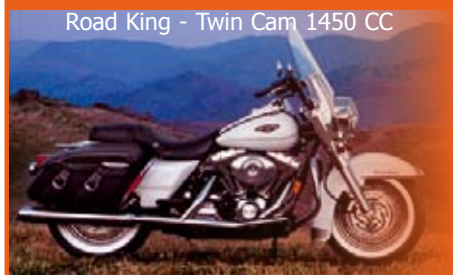
Road King - Twin Cam 1450 CC