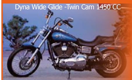
Dyna Wide Glide -Twin Cam 1450 CC