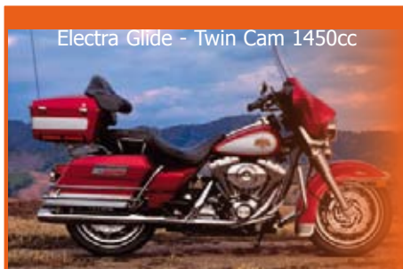
Electra Glide - Twin Cam 1450cc