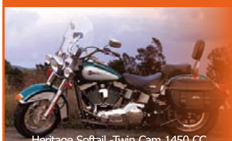
Heritage Softail -Twin Cam 1450 CC