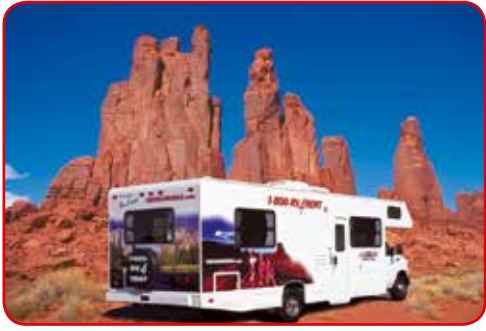
C30 Large Motorhome 9.1 Meters Long