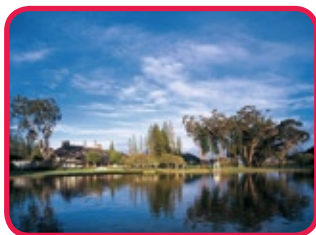
FOUR SEASONS LANAI THE LODGE AT KOELE ***** (LANAI)

Cet hôtel charmant, construit comme une immense villa de campagne, entouré de belles fleurs, plantes, d'arbres séculaires et se situe près d'un lac. Un excellent choix si vous aimez le calme, le romantisme, le luxe mais également pour les fervents de golf (Greg Norman 18-trous) et si vous aimez l'équitation, les randonnées à pied, en vélo ou en V.T.T. Toutes les chambres ont balcon ou patio et sont aménagées avec beaucoup de goût. Il y a plus: divers restaurants, bar et salons, centre de fitness et club de santé, piscine, bains tourbillon et près de l'hôtel Manele Bay (de la même chaîne Four Seasons) vous êtes invité à la plongée en apnée, la voile, le surf et une variété de sports nautiques à la plage.