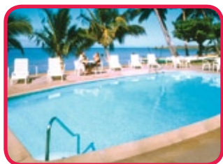
HOTEL MOLOKAI **

Hôtel de classe touriste, situé au littoral sud de l'île, près de la plage de Kamiloloa. L'hôtel est construit dans le style Polynésien et les chambres - réparties sur deux étages - sont simples mais pourvues de tout confort moderne. Il y a également un restaurant, un bar, des magasins et une piscine face à la mer. Bon rapport qualité/prix.