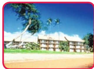
THE MOLOKAI SHORES SUITES **(*)

Cet hôtel de style Polynésien se situe à seulement 1 km. de la petite ville de Kaunakakai, face à l'océan et les 10 bâtiments de 3 étages sont entourés de jardins tropicaux. Les appartements sont très confortables pourvus de cuisine avec réfrigérateur, cafetière et tout confort moderne. Il n'y a pas de climatisation mais des ventilateurs de plafond. Il y a également: restaurant, bar, salon de coiffure, fleuriste, piscine avec barbecues et aire de pique-nique et plusieurs magasins et restaurants dans les alentours.