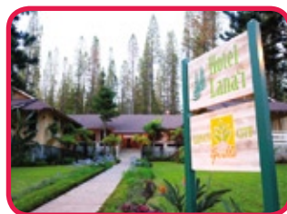
HOTEL LANAI ***

L'hôtel Lanai est un charmant petit hôtel qui se trouve au centre ville de Lanai. Davantage plus un Inn qu'un hôtel, ce logement romantique a été construit en 1923 par James Dole et était le premier hôtel sur l'île. Les 11 chambres sont décorées dans le style d'une vieille plantation et disposent d'un confort moderne - douche et toilette, service WIFI mais pas de télé. Le restaurant (le City Grille) est fabuleux, offre des plats succulents et un service très attentif. De la vraie nostalgie!