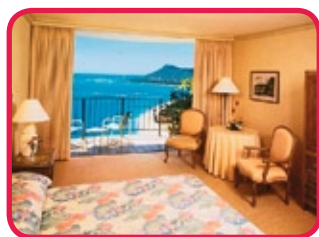
HILTON HAWAIIAN VILLAGE ****(*)

Un "paradis" pour ceux qui aiment la plage, palmiers tropicaux, étangs, chutes d'eaux, boutiques, etc. Ce "village-vacances" se compose de plusieurs bâtiments, restaurants, bars, boutiques, etc. baignant dans une atmosphère conviviale de vacances. Les chambres disposent de tout confort moderne (balcon, réfrigérateur, coffre-fort (payant),...) et d'une vue splendide. Trois piscines dont une "super-pool" et une lagune à l'eau de mer. Sports nautiques, croisières en catamaran et un spectacle Polynésien au Hilton Dome. Vous trouverez plus de 100 boutiques au Rainbow Bazaar et à l'Ali'i Tower Plaza.