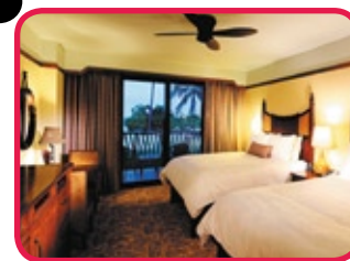
AULANI DISNEY RESORT AND SPA *****

Situé sur une belle plage, ce DISNEY Resort se trouve à 30 minutes de l'aéroport de Honolulu, près du parc Wet 'n Wild. L'hôtel dispose d'un spa tout équipé, 4 piscines extérieures et 4 bains tourbillons plus un centre de remise en forme. Ce beau village de vacances abrite 4 restaurants ainsi que 2 bars/salons et n'oubliez pas la piscine et le club pour enfants. Les 359 chambres sont aménagées d'une façon chaleureuse et ont coffre-fort, cafetière, balcon, télévision à écran plat et l'accès Internet et WI-FI est gratuit. La salle de bains comprend des peignoirs, des pantoufles, miroir de maquillage et beaucoup plus. Pour un séjour sensationnel!