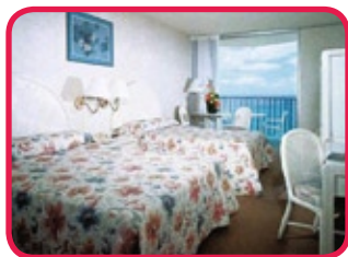
ASTON WAIKIKI BEACH HOTEL ***

Excellent hôtel dans sa catégorie, composé de deux tours et séparé de la plage par la promenade côtière. Complètement renouvelé en il y quelques années. Les agréables chambres sont décorées par les couleurs du tropique et équipées de tout confort moderne avec terrasse. Il y a également: piscine, restaurant, café, magasins et un bureau de vente d'excursions. L'hôtel se trouve proche du Zoo, de l'Aquarium et du parc Kapiolani.