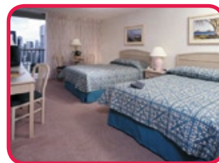
MIRAMAR HOTEL WAIKIKI ***

Hotel de catégorie standard, situé à Kuhio Avenue, voisin au célèbre marché en plein air "International Market Place", à deux blocs de la plage. Les 359 chambres ont un bon confort avec e.a. cafetière, frigo, sèche-cheveux, fer et planche à repasser, coffret (payant), climatisation et balcon. L'hôtel dispose également d'un restaurant, bar, salon, piscine avec solarium et un bureau de vente 'excursions' dans le lobby.