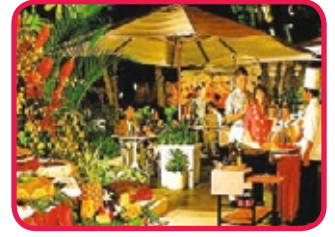
SHERATON PRINCESS KAIULANI ***

Vaste hôtel de classe supérieure, situé au centre de Waikiki, en face de la plage (séparé par la rue) et près de l'International Market Place. Les 1149 chambres sont réparties dans trois bâtiments et aménagées d'un confort agréable et moderne avec salle de bains, télé, climatisation, mini-bar, bouilloire, etc. Plusieurs restaurants, bars, boutiques, centre de fitness et piscine. Il y a en plus le Westin Kid's Club pour les 5 à 12 ans et un spectacle polynésien avec service repas.