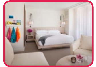
THE MODERN HOTEL ****

Cet hôtel à l'architecture design se situe juste à côté de la plage de Waikiki. Dôté de 2 piscines exotiques, 3 bars, un spa à service complet, un centre de remise en forme, une discothèque, un cinéma en plein air (système d'iPad) ...le tout pour vos vacances de rêve. Les chambres sont spacieuses, pourvues de connexion Wi-Fi gratuite, une télévision à écran plat, une vue dégagée et une belle salle de bains. Divers restaurants dont le 'Morimoto', un bar sushi avec vue sur la mer. A tenter!