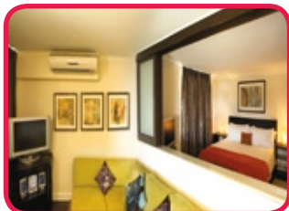
OUTRIGGER REGENCY ON THE BEACHWALK ***(*)

Excellent hôtel, moderne, propre et proche de restaurants et de magasins renommés. La plage de Waikiki et le Fort de Russy se trouvent à quelques pas de l'hôtel. Ce logement 'boutique' offre 48 appartements (1 ou 2 chambres à coucher) dans un quartier très animé. Toutes les unités disposent d'un bon confort avec une cuisine équipée, salle de bains, balcon et le décor a un coloris reposant. Vous y trouveriez en plus: trois restaurants donc un 'cuisine italienne' et un autre 'cuisine japonaise'. Il n'y a pas de piscine.