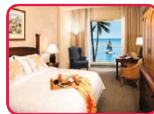
MOANA SURFRIDER, A WESTIN RESORT *****

La Grande Dame' de Waikiki Beach! Un rayonnement de charme, tradition et élégance sont regroupés dans cet hôtel luxueux situé à la plage. Les 791 chambres sont réparties sur 3 ailes et pourvues d'un confort élégant et moderne... beaucoup d'espèces de bois exotiques avec d'yeux pour les détails! Deux restaurants, salon, bar et un large gamme de sports nautiques à la plage. Un excellent choix à l'une ou l'autre occasion spéciale !