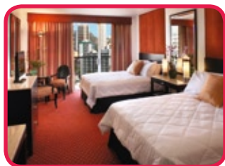
AQUA WAIKIKI WAVE HOTEL **(*)

Hôtel 'boutique' aménagé dans un décor 'trendy', situé au centre de Waikiki, à deux blocs de la plage et voisin à l'International Marketplace'. Vous y trouverez une atmosphère jeune et dynamique. Les chambres sont spacieuses, ont une terrasse et possèdent tous les aménagements vous assurant un séjour agréable et confortable. Vous y trouveriez en plus: deux restaurants, boutiques, service-concièrge, centre de fitness.