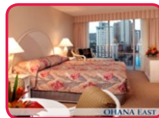
OHANA WAIKIKI EAST ***

Hotel respectueux, situé en plein centre de Waikiki, à peine à 200 mètres de la plage mythique de Waikiki, à quelques pas de l'International Market Place et des commerces et restaurants. Possibilité d'utiliser gratuitement les 'trolley' pour se rendre aux centres de shopping. Bien insonorisé et sécurisant, l'hôtel possède une piscine, un jacuzzi (serviettes fournies), un parking et les chambres sont spacieuses avec un bon confort.