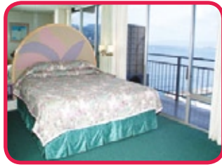
NEW OTANI KAIMANA BEACH HOTEL ***

Excellent hôtel, situé au pied de Diamond Head dans un cadre calme et voisin au parc Kapiolani, près de l'Aquarium et le 'zoo', à 10 minutes à pied de la plage de Waikiki. Cet hôtel ne bénéficie pas d'une piscine mais d'une plage où vous pouvez profiter d'une vue inoubliable sur le 'skyline' de Waikiki. Les chambres sont modernes, décorées de tons pastels. Elles présentent la fraîcheur du printemps, bon confort et ont une terrasse privée. En plus, vous y trouverez un restaurant réputé en plein air.