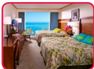
PACIFIC BEACH HOTEL ***

Excellente situation sur l'avenue Kalakaua, au bord de la plage, séparé par la promenade côtière. A quelques pas d'International Marketplace, le parc Kapiolani et le jardin zoologique. Un aquarium géant décore partiellement le lobby et le restaurant. Piscine, jacuzzi, courts de tennis, shopping, restaurants et cocktail lounge. Chambres bien aménagées et avec tout confort.