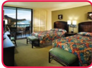
HOLIDAY INN WAIKIKI BEACHCOMBER ***

Hôtel moderne, complètement rénové en 2008, situé près de la plage, au milieu de l'action avec des magasins et restaurants aux alentours. Le grand lobby vous accueille dans un magnifique décor de tapis coloré et d'une belle boiserie. Les 494 chambres sont spacieuses, réparties sur 25 étages et offrent un excellent confort - vue sur la ville ou sur l'océan. Il y a en plus: piscine, centre de fitness, spa, restaurant, salon, bar et discothèque. Ambiance sympa!