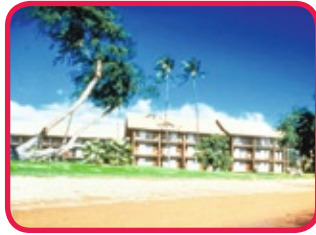
THE MOLOKAI SHORES SUITES **(*)

Gelegen in het rustige plaatsje Kaunakakai, vlak aan het strand, omringd door veel groen. De 31 condo's (appartementen) verspreid over 3 verdiepingen (geen lift) beschikken over een volledig ingerichte keuken met koffiezetapparaat en koelkast en bieden daarnaast ook badkamer, tv, radio, balkon/lanai, strijkijzer en strijkplank, geen klimaatregeling maar wel fan's aan het plafond. Dit complex beschikt ook over zwembad, barbecue grills, kapsalon, bloemist, shuffleboards en in de directe omgeving vindt u restaurants en winkels.