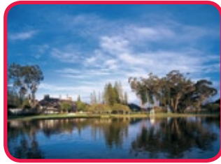
FOUR SEASONS LANAI THE LODGE AT KOELE *****

Topklasse hotel, als een reusachtig landhuis gelegen tussen oude bomen, schitterende bloemen en planten en vlakbij een meer. Een uitstekende keuze voor wie houdt van romantiek, rust en luxe maar zeker ook voor ervaren golfers (Greg Norman 18-holes) en houdt van paardrijden, mountain biken en wandelen. Alle kamers hebben balkon of patio en verwelkomen u in een gezellig decor. U vindt er restaurants, bar en lounges, fitness complex met spa-faciliteiten, zwembad, twee jacuzzi's en vlakbij het zusterhotel Four Seasons Manele Bay kan u op zee surfen, zeilen, vissen, snorkelen en genieten van zon en strand.