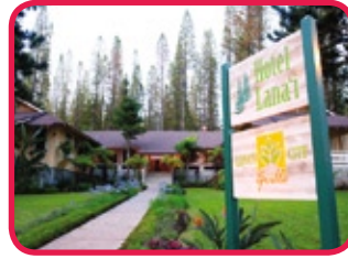
HOTEL LANAI ***

Dit historisch hotel werd gebouwd in 1923 door James Dole als verblijfplaats voor de bedrijfsverantwoordelijken van de Dole ananas plantage. Tot 1990 was dit het enige hotel op het eiland. Hotel Lanai bevindt zich in het centrum van het stadje Lanai en biedt een warme en gezellige atmosfeer. U vindt er 11 kamers ingericht in het typische Hawaiaans decor van vroeger, voorzien van douche, toilet, haardroger en gratis WIFI. Er is tevens een restaurant waar uitgebreide en heerlijke schotels geserveerd worden. Nostalgie ten top !