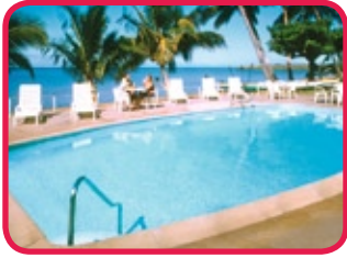
HOTEL MOLOKAI **

Budget hotel, gelegen aan de zuidkust van het eiland, vlakbij het strand van Kamiloloa. Het hotel werd opgetrokken in typische Polynesische laagbouw en de kamers zijn eenvoudig ingericht maar bieden alle nodige comfort. U beschikt er tevens over een restaurant, cocktailbar, winkels en een zwembad met zicht op zee.