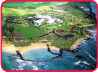
ASTON ALOHA BEACH RESORT ***

Familiehotel, gelegen aan de oostkust van het eiland (Kapaa), aan de overkant van Wailua River en vlakbij het strand, Lydgate Beach Park en shopping. De 216 kamers zijn ingericht in een Hawaïaanse decor en voorzien van alle modern comfort (koffiezetapparaat, strijkerief, haardroger, mini-koelkast, geldkoffertje, enz.). Twee zwembaden, jacuzzi, fitness, tennis en volleybal zijn slechts enkele activiteiten ter plaatse. Daarnaast is er ook een restaurant, bar en grill.