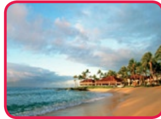
SHERATON KAUAI BEACH RESORT ****

Volledig vernieuwd hotel, gelegen aan Poipu Beach, vlakbij Moir Gardens en de Kiahuna golfbaan. Dit resort biedt een verscheidenheid aan activiteiten met twee zwembaden, een spa, een speciaal kinderprogramma en watersportfaciliteiten aan het strand. Diverse restaurants serveren een uitgebreid assortiment aan Amerikaanse, Internationale en Hawaïaanse gerechten. De mooi verzorgde kamers beschikken over e.a. flatscreen televisie, koelkast en balkon.