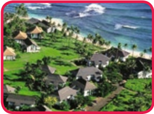
OUTRIGGER KIAHUNA PLANTATION ***

Uitstekend hotel, gelegen aan het uitgestrekte strand van Poipu, op slechts een paar kilometer van het historische stadje Koloa. U geniet er van een ontspannen en authentieke 'aloha' sfeer. Dit complex met 333 appartementen, omringd door veel groen, biedt een uitstekend comfort en iedere unit beschikt over een keuken. Naast heel wat faciliteiten aan het strand is er ook golf en tennis vlakbij, plus eigen kinderprogramma in het hotel. Dit domein beschikt verder ook over restaurant en bar en een mooie cactus en orchidee tuin.