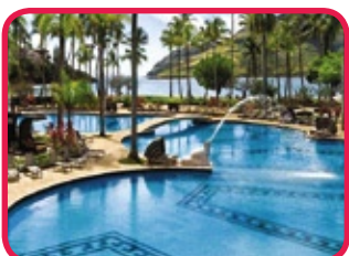
KAUAI MARRIOTT BEACH RESORT ****

Prachtig hotel, gelegen aan een mooi stuk strand vlakbij Lihue en recent volledig vernieuwd. Dit hotel beschikt over één van de grootste zwembaden van het eiland en aan het strand geniet u van een ruim aanbod aan watersport activiteiten. Verder is er een golfterrein, tennis courts, volleyball court, fitness, spa, speciaal kinderswembad en de 'Kalapaki' kinderclub. De kamers zijn ruim en prachtig ingericht, veelal met balkon of terras. U vindt er diverse restaurants waarvan enkele in openlucht, terras, café, enz. Een uitstekende keuze.