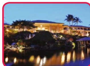
GRAND HYATT KAUAI RESORT & SPA *****

Het meest Hawaïaanse hotel van alle Hyatts. Gelegen aan het zonovergoten strand van Poipu, vlakbij een lagune met privé-eiland. Als gast vindt u er de nostalgie uit de jaren '20 en '30. Geniet van de open veranda's, palmbomen, twee zwembaden, vier tenniscourts, een 18 hole golfterrein en van het fantastisch ANARA health & fitness complex met whirlpools, massages en body treatments. Diverse restaurants en bars verwennen u tussendoor.